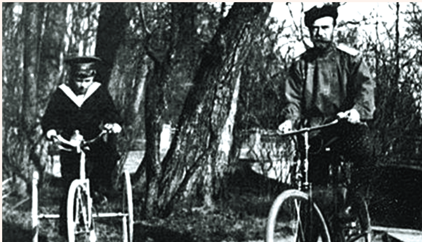
Император Николай II и цесаревич Алексей в Александровском парке Царского Села 1913

«В это время в России были популярны велосипеды, и в 1903 году Николай II разрешил городским думам взимать сбор с этого вида транспорта в размере не более 1 рубля 50 копеек.»