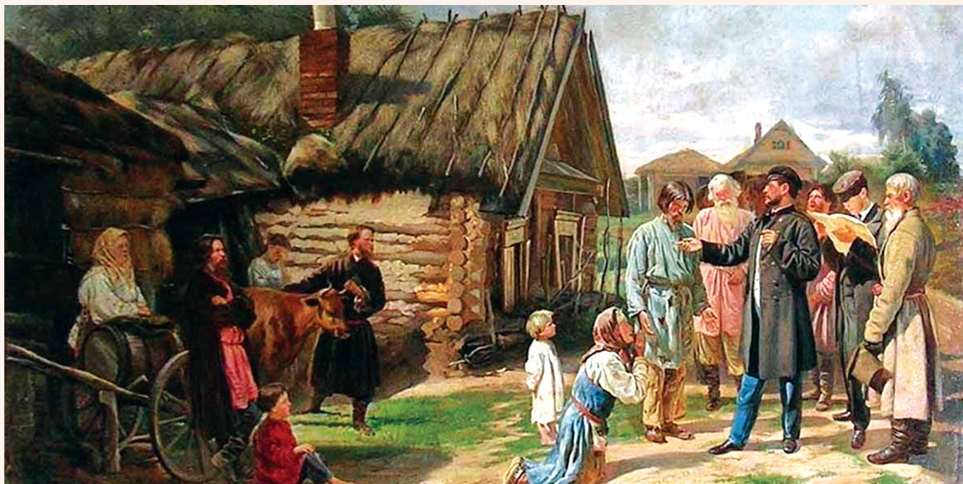
Василий Пукирев Сбор недоимок Государственный музей политической истории России, Санкт-Петербург 1875